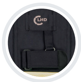
Zusätzliche Lampenhalterung mit Fixierung per Karabiner und Klettverschluss